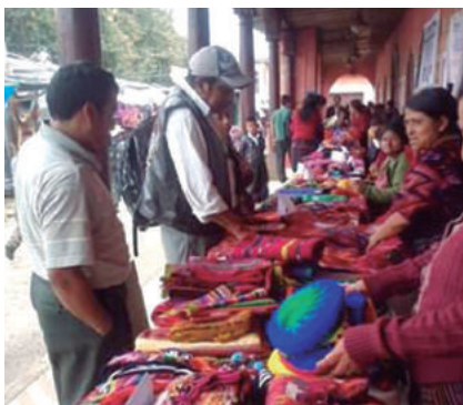
Chichicastenango. "Feria Masheña", frente a la Municipalidad Indígena, los jueves de 8:00 horas en adelante.