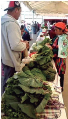
Huitán. Plaza Central, todos los sábados de 6:00 horas en adelante.