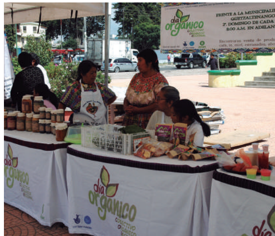
Quetzaltenango. parque central, el segundo domingo de cada mes desde las 8:00 horas.