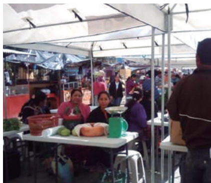
Cabricán. "En Terreno Cabricaneco del Nuevo Milenio" en Plaza Central, todos los sábados, a partir de las 8:00 horas.

LOS MERCADOS LOCALES MEJORAN LA ARTICULACIÓN DE LOS AGRICULTORES DE PEQUEÑA ESCALA DE LAS ZONAS RURALES Y LOS CONSUMIDORES DE LA CIUDAD, CON EL FIN DE AUMENTAR LOS INGRESOS DE LAS FAMILIAS AGRICULTORAS Y MEJORAR AL MISMO TIEMPO EL SUMINISTRO DE ALIMENTOS FRESCOS ACCESIBLES PARA LOS CONSUMIDORES EN LAS CIUDADES.