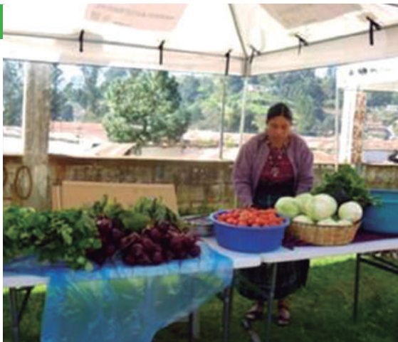
Cantel. Paseo Artesanal en Antigua Fábrica Cantel, todos los domingos, 8:00 horas.