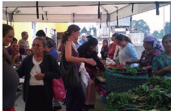
Mercado La Hojita, en 9ª. Calle 19-47 zona 3, Oficinas de SERJUS, todos los viernes cada quince días, de 10:00 a 12:00 horas.